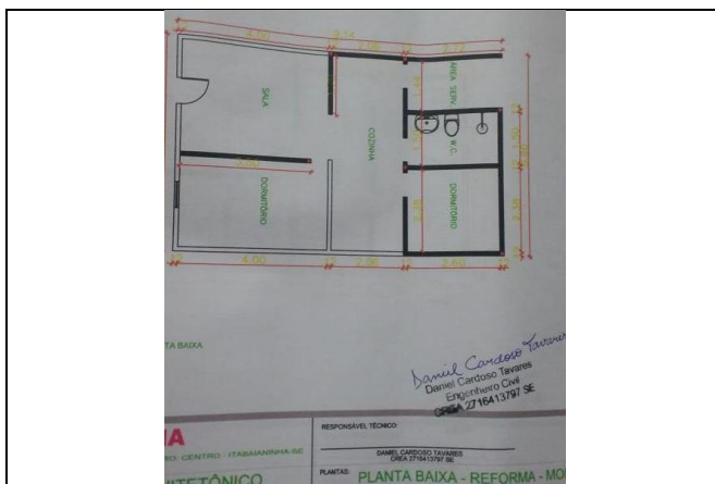
29/3/2018 – Il progetto della nuova casa

Le spese hanno riguardato principalmente l'acquisto degli infissi quali porte e finestre per R$ 2.955,00, materiali da costruzione come inerti, cemento, ceramica per pavimenti, legname per la riparazione del tetto per R$ 1.894,00, materiale idraulico e sanitari per il nuovo bagno per RS190,40 e manodopera per R$ 2.910,00; in totale R$ 7.949,40. Di seguito alcune foto del microprogetto.