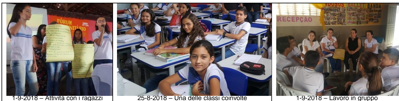
1-9-2018 – Attività con i ragazzi