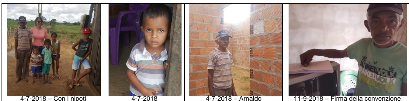
4-7-2018 – Con i nipoti

A fine ottobre 2018 sono state rendicontate le spese per l’acquisto dei materiali per la realizzazione del tetto. Di seguito alcune immagini dei materiali acquistati e dei lavori: