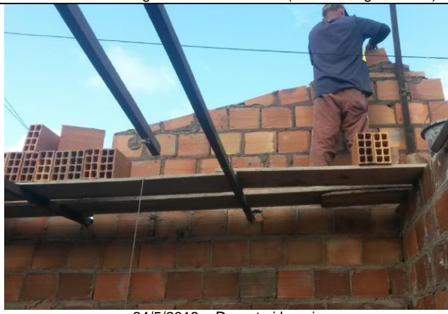
24/5/2018 – Durante i lavori