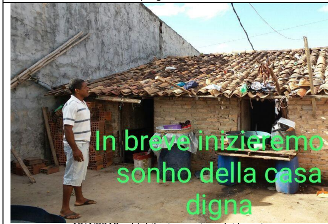
13/4/2018 – L'abitazione prima dei lavori