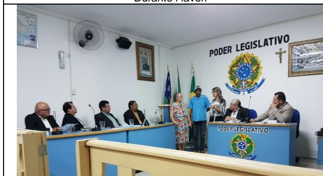
La presentazione del progetto in Municipio