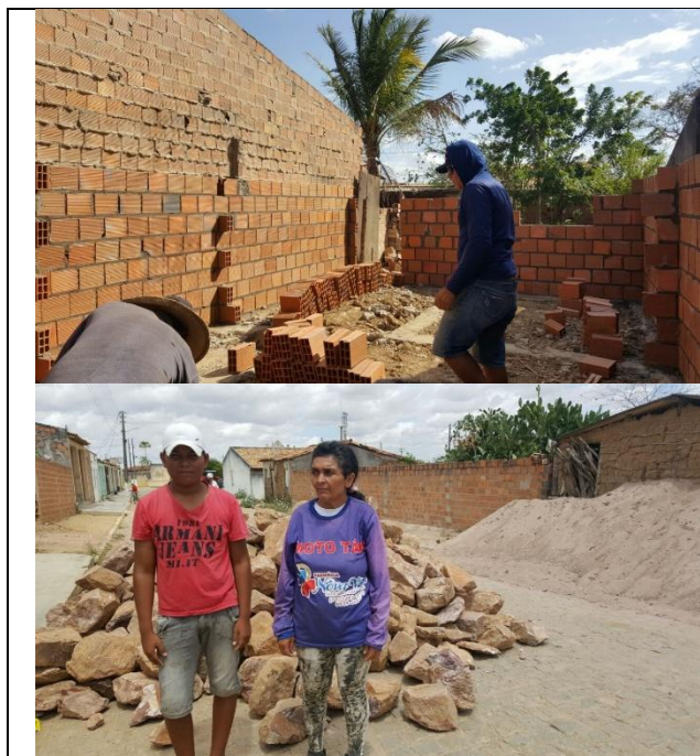
Durante i lavori