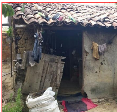
La vecchia abitazione in terra cruda 15 giugno 2016