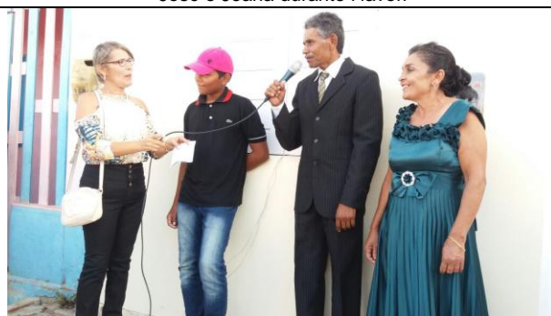
Un momento dell'inaugurazione della nuova casa